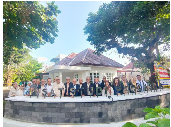
Gambar berkumpulan di hadapan bangunan Pusat Studi Pancasila