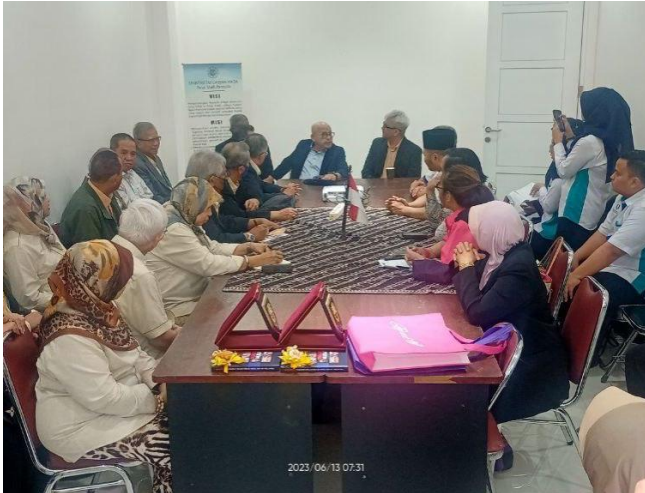
Para hadirin yang mengikuti sesi perbincangan antara UMP dan PSP